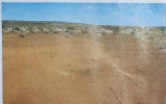
LINKS: Dis soos die veld gelyk het voer mnr. Piet Roux begin het om vore te ploeg.