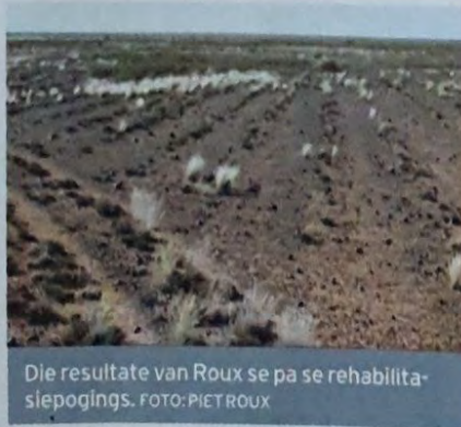
Die resultate van Roux se pa se rehabilitasiepogings.