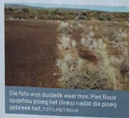
Die foto wys duidelik waar mnr. Piet Roux opgehou ploeg het (links) nadat die ploeg gebreek het.

Maar hoe weet 'n boer wanneer om vee minder te maak in die droogte? "As jy weet wat in jou veld aangaan, weet jy wanneer om jou vee te verminder. Ek het reënmeters oral wat my leiding gee oor my veldpotensiaal. ▶