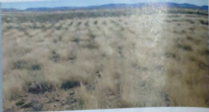
REGS: Die veld herstel ná goeie neerslae.

◀ Teen einde April weet jy gewoonlik hoe die seisoen vorentoe gaan lyk."